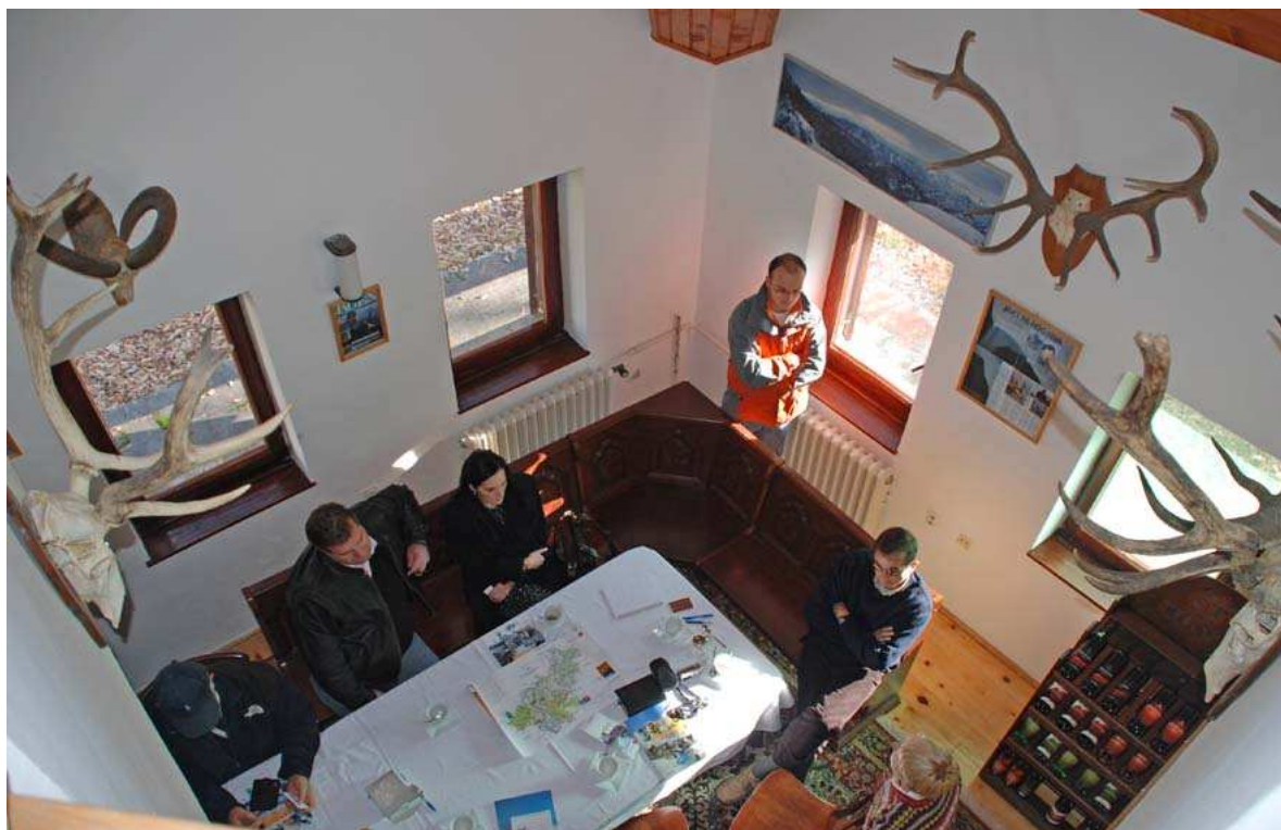
Réunion dans le pavillon de chasse de Jacen