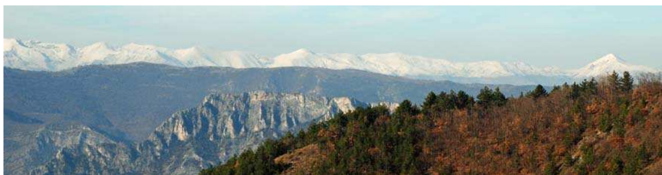
Chaîne de Shar Planina vue de Jacen